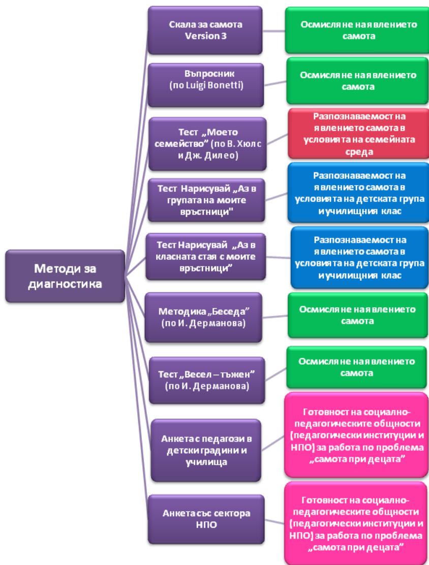
Схема 2. Връзка между методи за диагностика и критерии

След направения подбор комплексната методика за изследване включва (Схема №2):