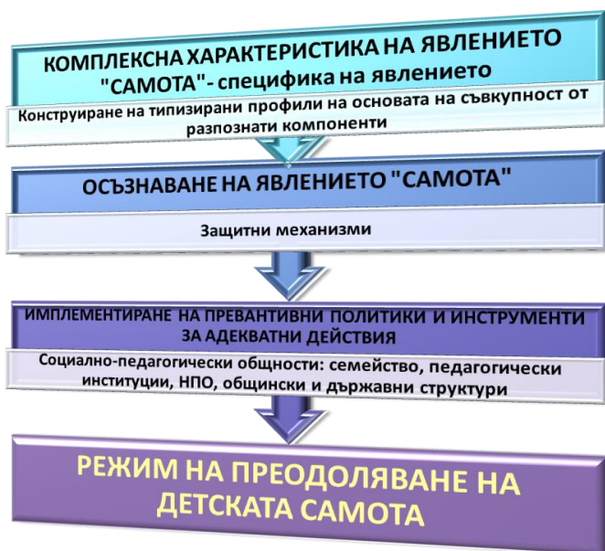
Схема № 3. Постигане на режим на преодоляване на детската самота

➤ Режим за преодоляване на детската самота – необходими стъпки. В схематичен план той включва - Схема №3: