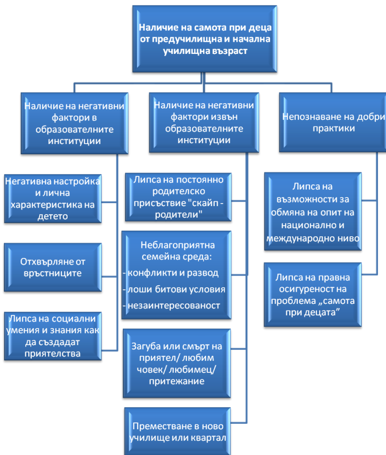
Схема 1. „Дърво на проблемите“

наука. Тя е призвана да открие причините за появата на детската самота, както и актуалния педагогически инструментариум за нейното преодоляване. Следствието от осъщественото теоретично проучване върху проблематиката „детска самота“ е възможността да се оформи схема на „Дърво на проблемите“ на децата във възрастта от 5 до 11 години - Схема №1.