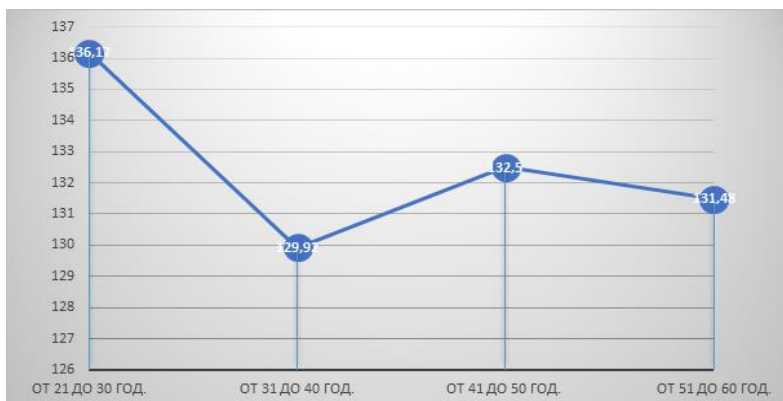
Графика №1: Представяне на динамиката на афективния аспект на удовлетвореността от съвместното съжителство спрямо възрастта

Разглеждайки Графика №1, където визуално представяме динамиката на удовлетвореността от афективния аспект на удовлетвореността от съвместното съжителство във възрастов план, установяваме, че пика на удовлетвореността е във възрастовия диапазон от 21 до 30 години. След резкия спад в удовлетвореността от афективния аспект на удовлетвореността от съвместното съжителство във възрастовия диапазон от 31 до 40 години, следва леко покачване на стойностите в периода от 41 до 50 години и запазване на почти същите стойности на афективния аспект на удовлетвореността от съвместното съжителство във следващия възрастов период от 51 до 60 години.