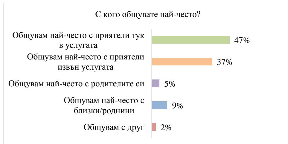
Графика 3. Общуване на децата и младите хора

Другият фактор е възрастта на децата. Анализът на данните показва, че колкото по-големи са децата, настанени извън семейна среда, толкова по-рядко общуват или не поддържат връзка с родителите и близките си. 33 % от децата между 12-15 г. и 48 % от децата над 16 г. не поддържат връзка с родителите и близките си.