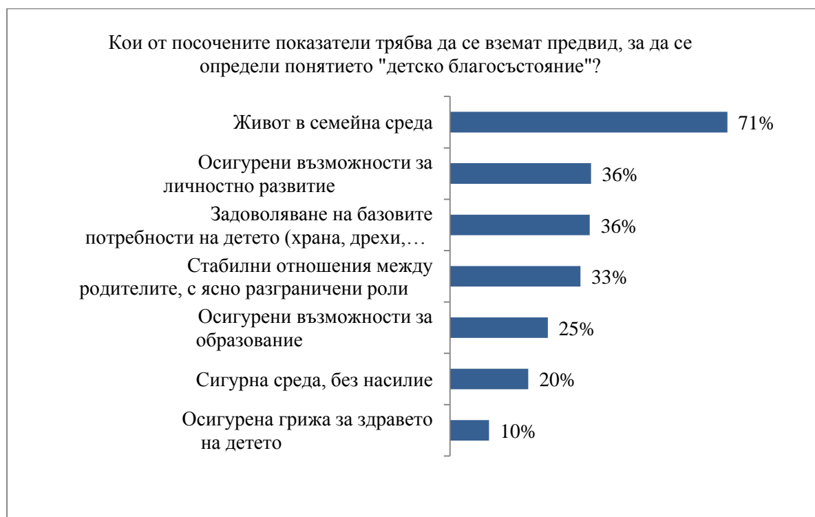
Графика 1. Фактори за детско благосъстояние

В допълнение, 51 % от професионалистите, участвали в изследването, определят като основен подход в социалната работа семейно - ориентираният, който да осигури подкрепа за родителите и работа със семейната система, за да се постигне и повиши детското благосъстояние. Анализът на отворените въпроси показва, че професионалистите, участвали в изследването разбират и определят семейно –