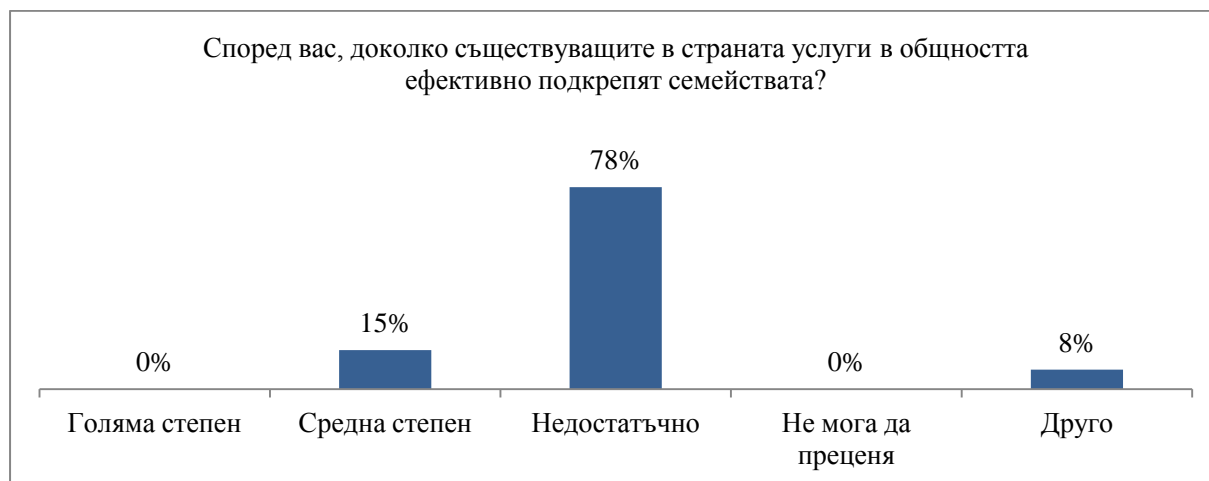
Графика 2. Ефективност на работата със семейства

Основанията за тези отговори могат да се търсят в липсата на услуги, директно ориентирани към подкрепа на родителите, политиката в страната, насочена предимно към закрила на децата, липса на семейно - ориентирана политика, с неизяснени докрай модели за работа със семействата, липса на стандарти и индикатори за измерване на ефективността на услугите като цяло и др.