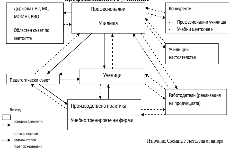
Фиг 1. Модел за анализ на управлението на дейностите в професионалното училище

Посочената схема е опит на автора да се изгради основа за анализ на управлението на дейностите в професионалното училище. Началната база за извършване на анализа на дейностите е заложена в нормативната уредба. В дисертацията е развита идеята за създаване на институция за външно оценяване на системата чрез комплексна оценка. Това специално звено може да бъде агенция за акредитация на структурите в СПО. Обоснована